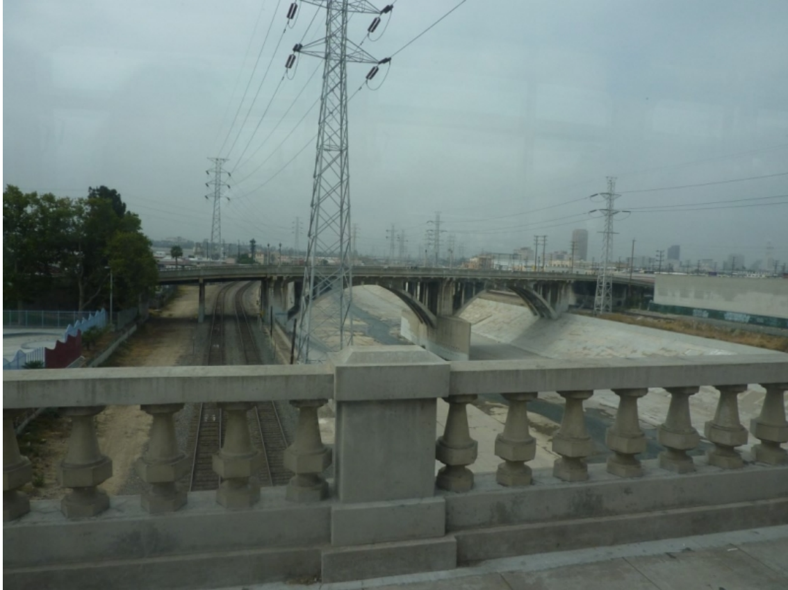
Hélène Schmutz, juin 2010.