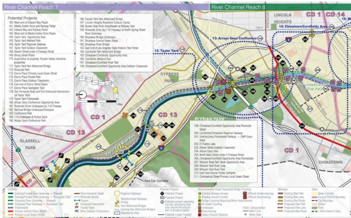
Moore 2007 : 259.

20 Les plus connus sont la LARiverWay ( http://www.lariver.org/blog/lariverway-design-and-implementation ) : une piste cyclable le long de l'intégralité de la portion du fleuve sous la juridiction de la commune ; la Los Angeles River Recreation Zone (Sepulveda Basin et Elysian Valley) : deux zones de loisirs ouvertes en 2017, sujette à fermetures en fonction de la qualité de l'eau. Il est possible de faire du kayak par exemple sur certaines portions du fleuve, des randonnées et de la pêche ; Albion Riverside Park, parc comportant des complexes sportifs et un centre de traitement de l'eau ; Taylor Yard « G2 » Project (qui se trouve au cœur de la controverse concernant la gentrification) ; Los Angeles Historic State Park et la Bowtie Parcel. Il y a aussi une initiative privée de recréation d'une roue à eau rappelant le passé de la ville, menée par l'artiste Lauren Bon : « Bending the River Back » Into the City Water Wheel (qui donne suite à son projet de champ de maïs en plein downtown « Not a Cornfield »), comportant lui aussi un centre de traitement de l'eau. Zones de loisirs, complexes sportifs, stations d'épura-