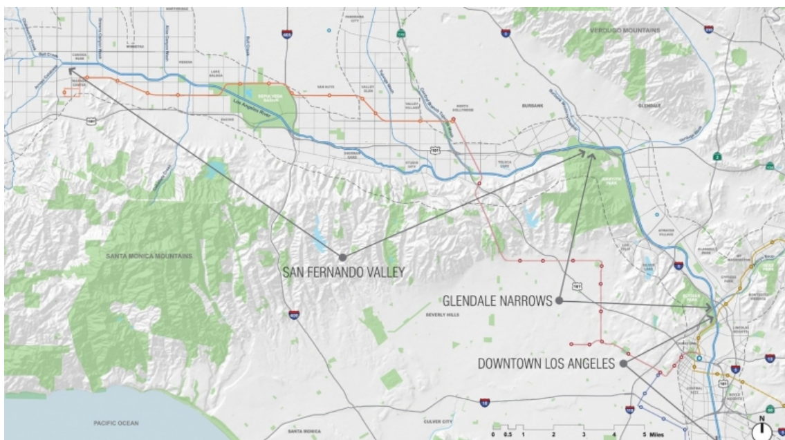
Moore 2007: 2.