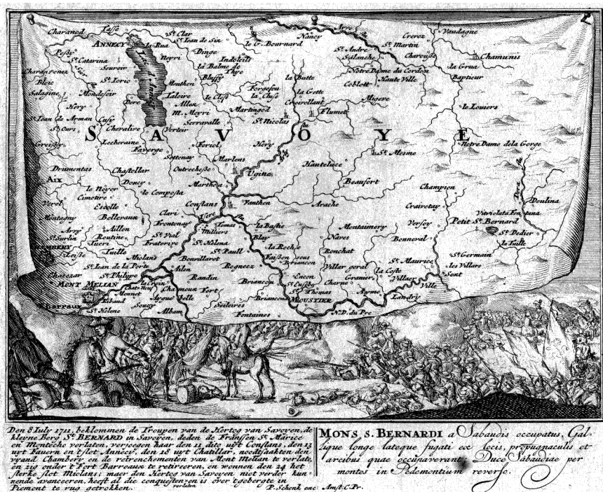
FIGURE 1 – Célébration du passage au Petit-Saint-Bernard, le 8 juillet 1711, de l'armée sabardo-autrichienne conduite par le Duc de Savoie Victor-Emmanuel II à la rencontre des troupes françaises du Duc de Berwick occupant le duché : l'illustration d'un épisode des incessantes opérations militaires des Temps Modernes à travers le col du Petit-Saint-Bernard et la Tarentaise 92

où il sera possible de les ensevelir ; de marquer les chemins publics du Mont avec des perches ou jalons, pour que les passants ne s'y égarent point » 91 .