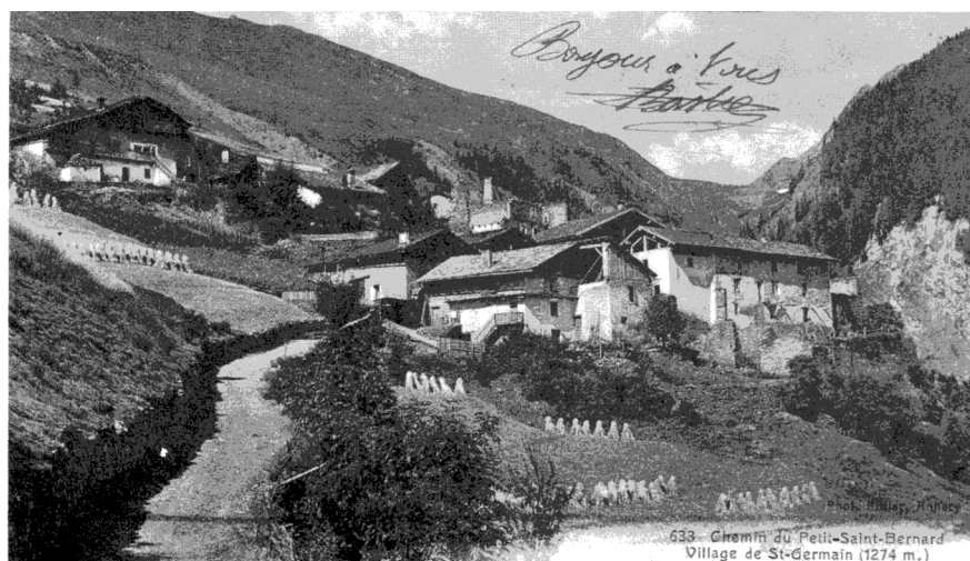
FIGURE 4 – Le village de Saint-Germain au début du XX e siècle (En arrière plan, la voie romaine surplombant le vallon du Creux-des-Morts) 131

bel et bien la mise en chantier d'un nouvel itinéraire, plus long, plus commode et surtout complètement carrossable sur le versant opposé du vallon du Reclus. Les travaux ne débutent cependant qu'avec le Second Empire, après 1860, pour s'achever en 1872, versant français, par l'inauguration de l'accès des premières voitures au col 132 . De l'automne 1792 à cette date, y compris lors de l'épisode militaire de « l'Époque intermédiaire » puis celui de la Restauration sarde, de 1814-1815 à 1860, les habitants volontaires de Saint-Germain deviennent officiellement adjudicataires des tâches de cantonniers ou de « jalonnes » de la vieille chaussée par le biais de la soumission « à prix fait », puis, bientôt, du salariat pur et simple. Même s'ils subissent dorénavant la concurrence, dans cette carrière de commettant officiel de l'Administration, de tous les habitants de la commune de Séez, voire de ceux des autres communes voisines en dehors de toute référence à l'exclusivité garantie naguère par les privilèges de 1259 133 .